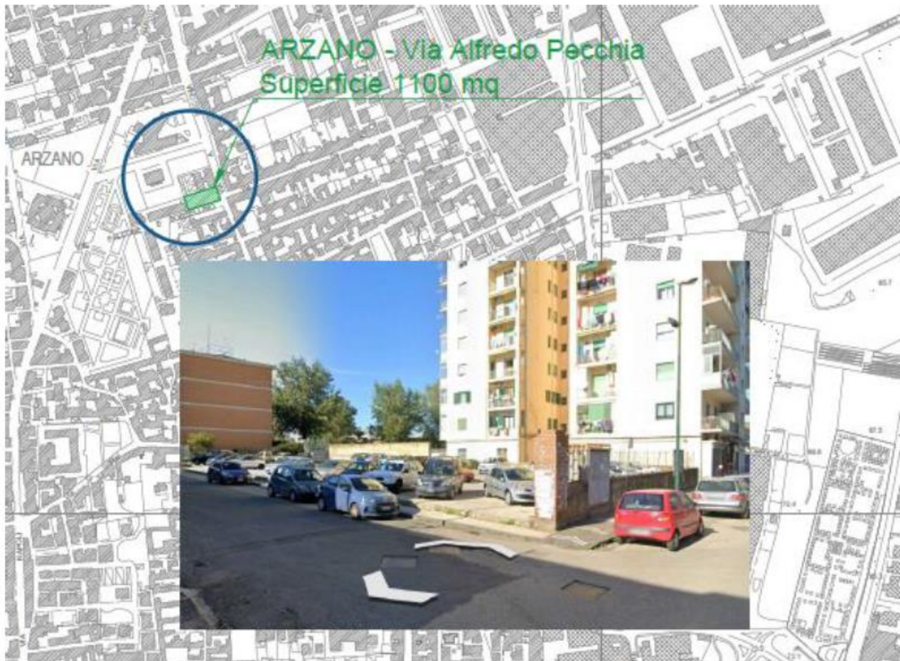
Figura 1. Collocazione territoriale area di intervento

Si riporta di seguito l'inquadramento satellitare del sito e del complesso.